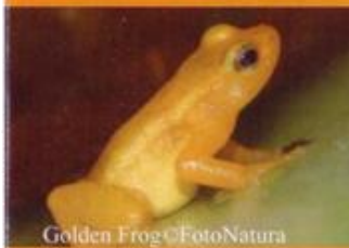
Golden Frog

Als gevolg van de snelle vernietiging van hun leefgebieden, zijn deze kikkers op dit moment op de lijst van bedreigde dieren. zonder maatregelen om hun natuurlijke leefgebieden te beschermen, kan de dart-gifkikker uitsterven. hun uitsterven vermindert de diversiteit van de fauna en het voorkomen van veel nieuwe chemische stoffen die worden ontdekt.