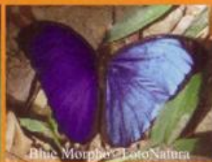
Blue Morpho