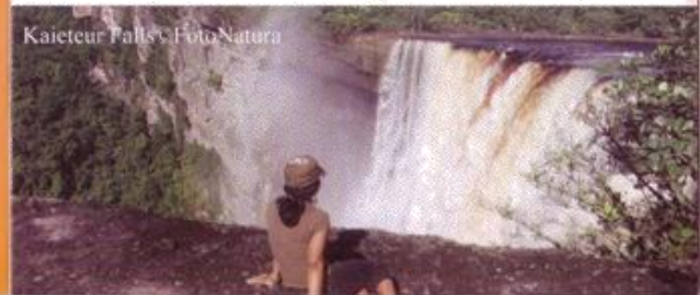
Kaieteur Falls

Gasten kunnen kiezen voor een verblijf in een van de twee slaapkamers of een van de vele comfortabele hangmatten die beschikbaar zijn te gebruiken.