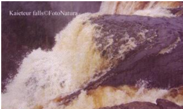
Kaieteur falls